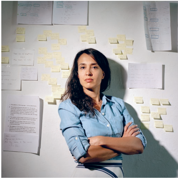
Martina Potratz Schauspielerin 2015 Texte und Notizen im Zuger Atelier