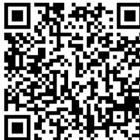
QR (für Android)