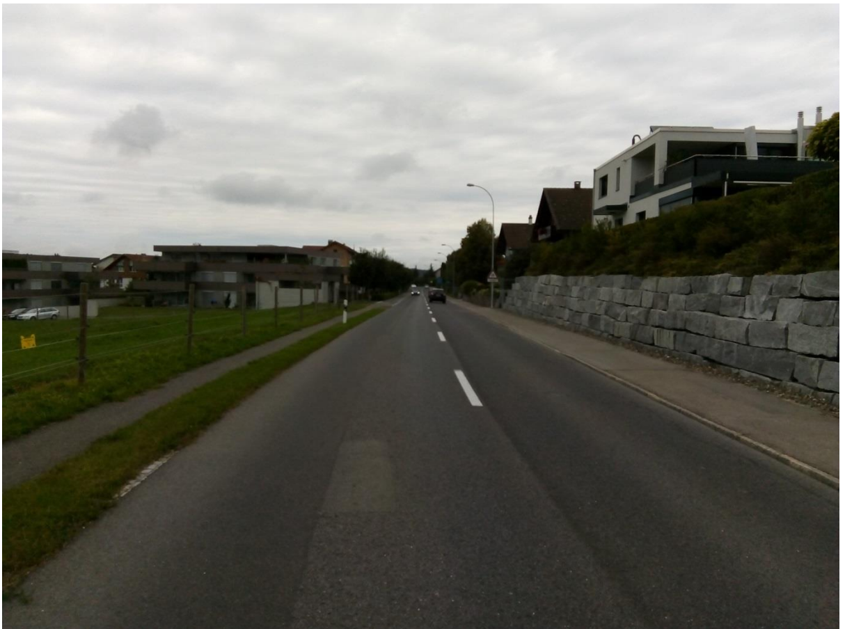
Aktuelle Aufnahme der Holzhäusernstrasse

Tel. +41 41 728 53 48, maciej.sienkiewicz@zg.ch