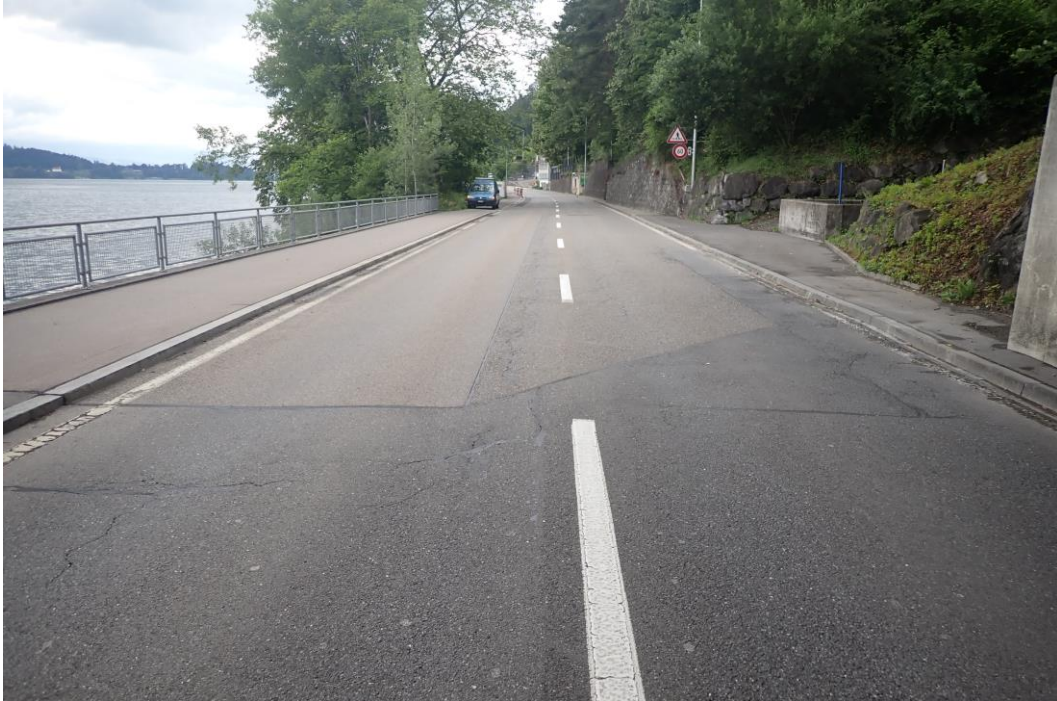
Die Kantonsstrasse 25 im Bereich Grindwäschi in Walchwil in Blickrichtung Zug.