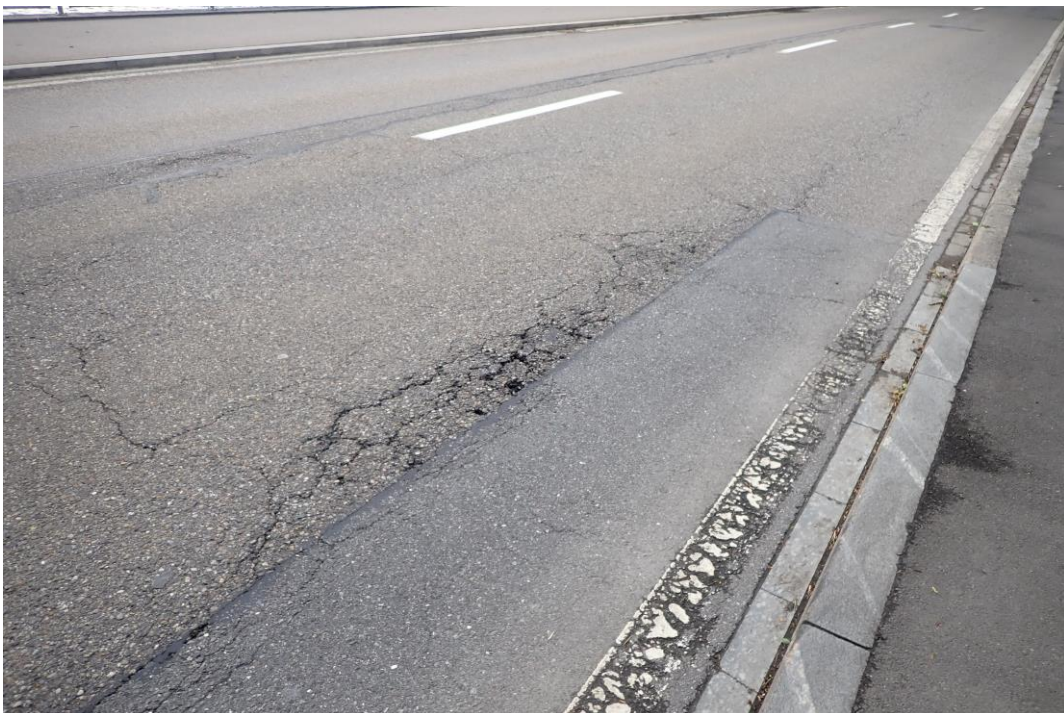
Der Belag der Kantonsstrasse im Bereich Grindwäschi in Walchwil muss dringend saniert werden.