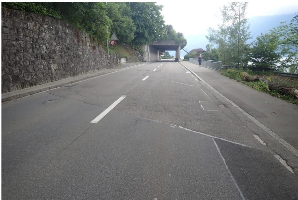
Der Bereich der Kantonstrasse im Bereich Grindwäschi in Walchwil muss saniert werden.