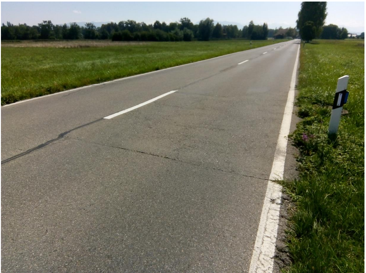
Aktuelle Aufnahme der Maschwanderstrasse in Hünenberg, die bald saniert wird.