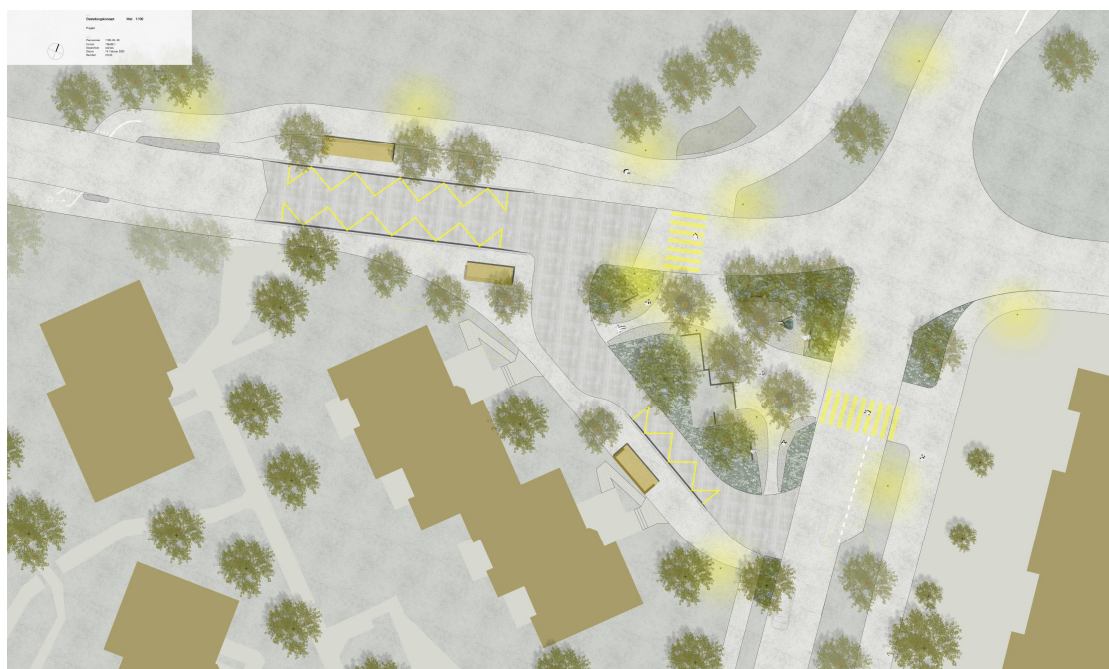
Neugestaltung Bushaltestelle Inwil (aus Gestaltungsplan Auflageprojekt)

Nach Abschluss der Tiefbauarbeiten erfolgt die Ausrüstung der Bushaltestelle Inwil und des neu gestalteten Platzes im Bereich der Buswendeschleife. Inbetriebnahme der neuen Bushaltestelle ist im Frühling 2021 vorgesehen. Die provisorische Bushaltestelle auf der TZB-Achse wird dann wieder aufgehoben. Abschluss der gesamten Bauarbeiten bilden der Deckbelagseinbau im April und Mai 2021 sowie Signalisation und Markierung der neuen Verkehrsführung.