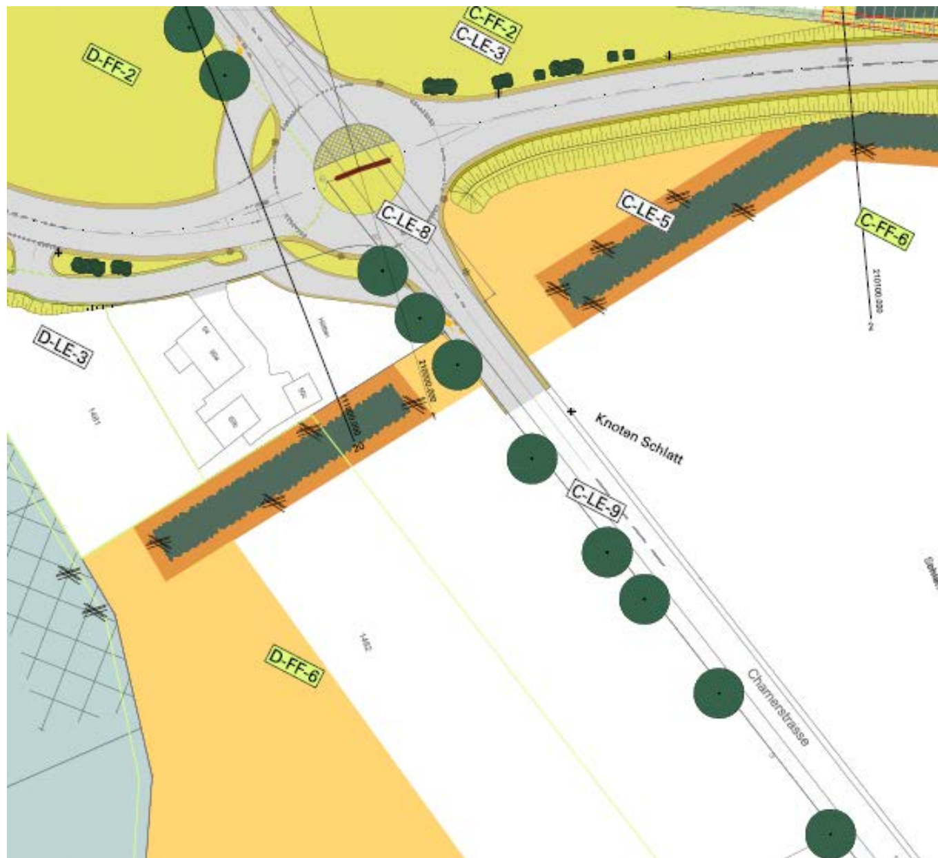
Abb 1.1 Kein Kleintierdurchlass