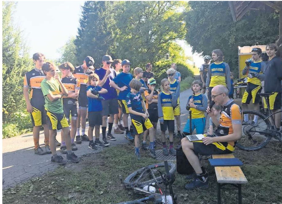
Die Teilnehmenden des Cups in Deinikon erholen sich nach dem Rennen.

Bei der Clubmeisterschaft des VC Baar-Zug sind 24 Athletinnen und Athleten gestartet.