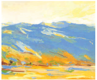
Zugerberg in Acryl

der Industrie tätig war und verschiedene Unternehmen leitete. Aber der Drang zu malen, kehrte immer zurück.