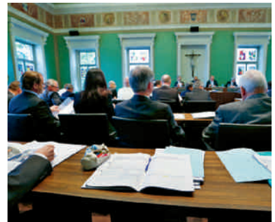
Blick in den Kantonsrat

Das Unterrichten macht mir Spass, zudem gehören viele Kolleginnen zu meinen besten Freundinnen. Wir fahren zusammen in die Ferien, etwa nach Gran Canaria zum Kitesurfen. Mit wackligen Beinen auf dem Brett machte ich glaub eine eher jämmerliche Figur. An der Schule haben wir die Arbeitsgruppe «Shopping» gegründet. Wir gehen zusammen einkaufen, was eigentlich durchgehen müsste als interdisziplinäres Projekt, oder nicht? Schliesslich geht es bei der Beschaffung neuer Schuhe und Shirts um leider allzu oft Unterschätztes: die modische Grundausstattung junger Kanti-Lehrerinnen.