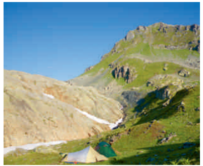
Zelte zwischen Juf und Maloja

Aber natürlich schätze ich Projekte, bei denen ich mit den Schülerinnen und Schülern in der Natur etwas erleben kann. Die Tendenz, dass man heute aus Sicherheitsüberlegungen eher auf Aktivitäten verzichtet, die früher gang und gäbe waren, stört mich. Wenn man heute alle Richtlinien konsequent umsetzen will, dann schaut man im Schulzimmer einen Bergsteigerfilm, statt draussen die Berge selber zu erleben. Den Jugendlichen entgeht dadurch etwas.