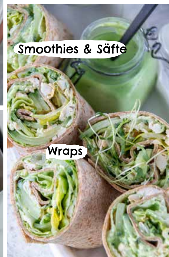
Smoothies & Säfte