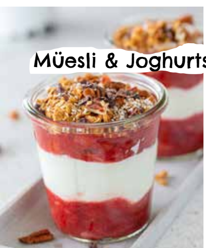
Müesli & Joghurts