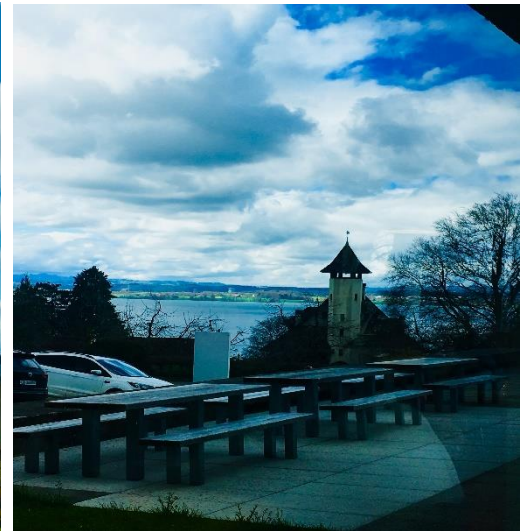
Der Ausblick von der PH auf den See.