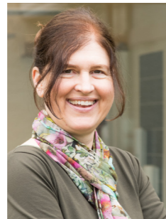
Esther Kamm Rektorin der PH Zug

Gleichzeitig richtet sich der Blick nach vorn. Die Strategie 2027–2030 ist in Vorbereitung. Der Prozess wurde im Sommer 2025 mit einem hochschulweiten «Call for Projects» lanciert. Die vielen eingereichten Projekte zeigen das grosse Engagement und die Innovationskraft der Mitarbeitenden.