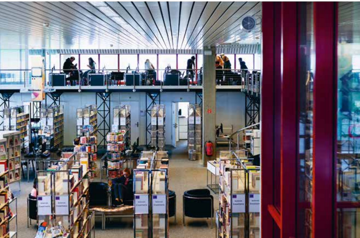
Das Info-Z – Ort des Lernens und des Verweilens.