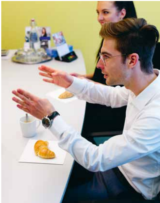
Begeisterung, Engagement und Kompetenz – gerüstet für Beruf oder Studium.