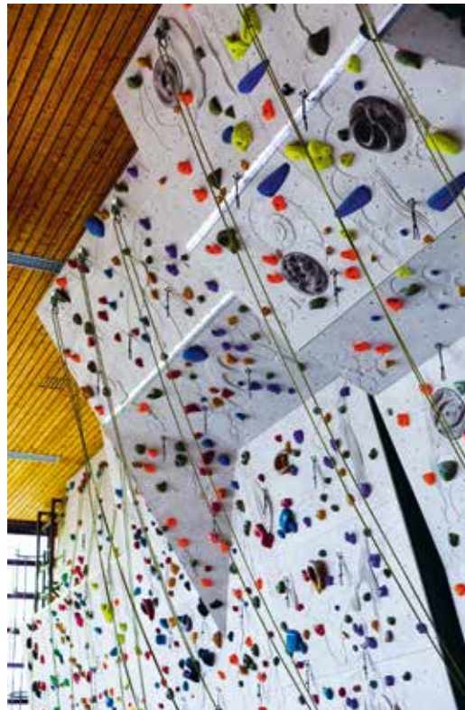
Das Freifach Klettern ist nur eines aus dem vielfältigen Freifachangebot.