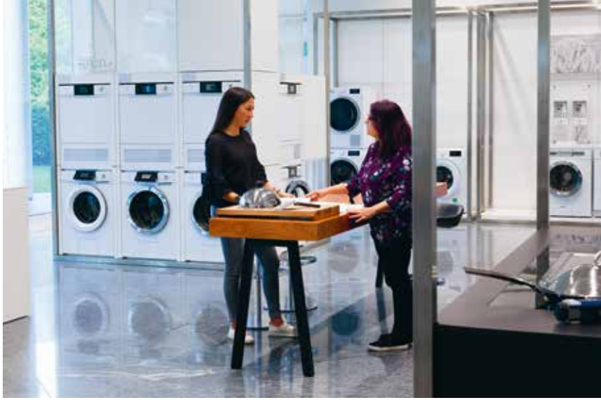
Je nach Betrieb erhalten die Lernenden Einblick in verschiedene Abteilungen des Unternehmens.