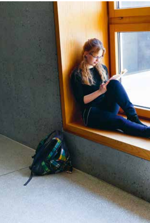
Zu einer intensiven Ausbildung gehören auch Pausen.