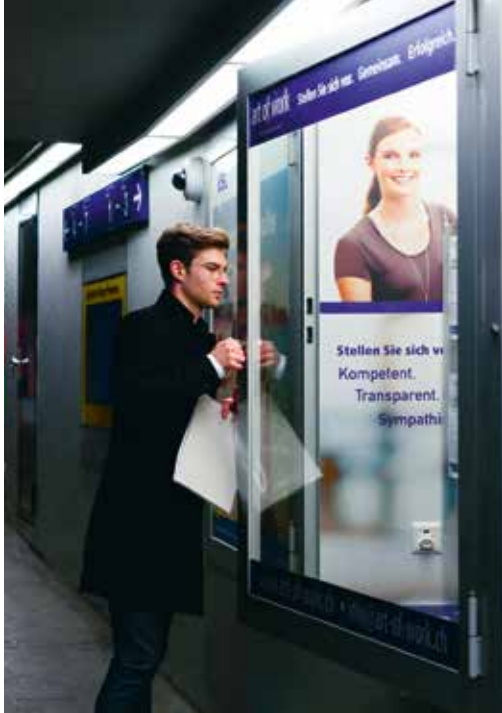
Auch Tätigkeiten ausser Haus gehören zum Praktikum.