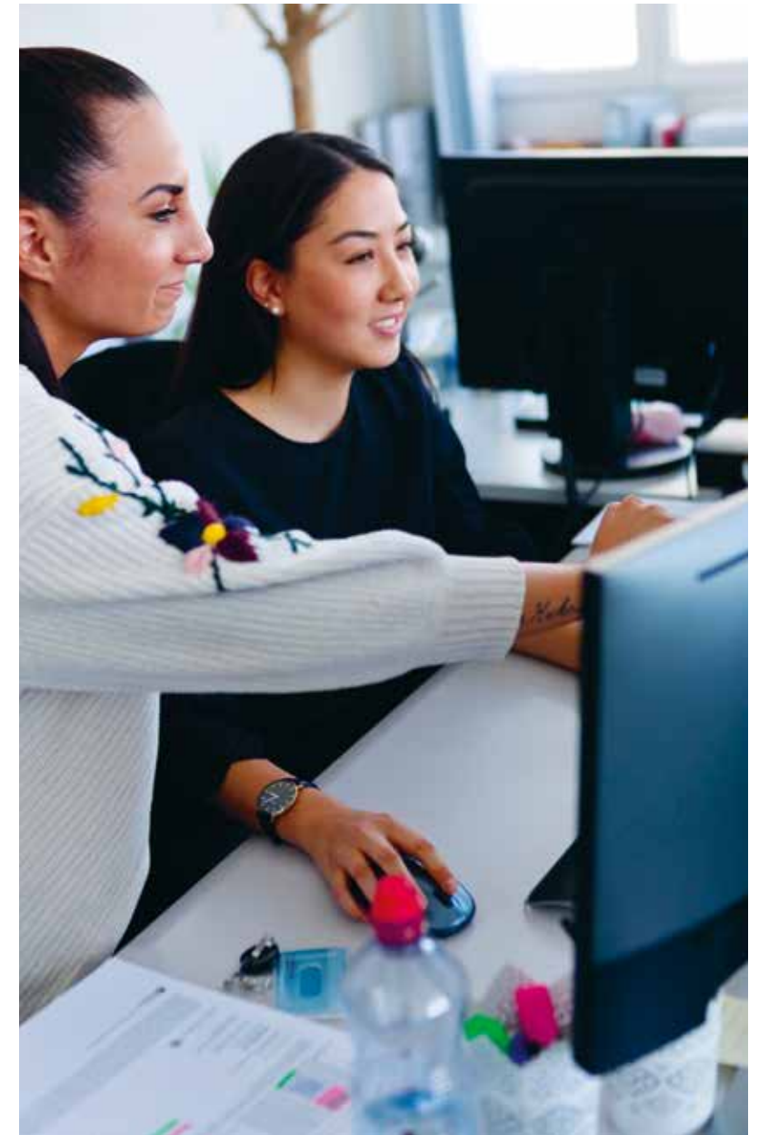
Am Arbeitsplatz werden die Praktikantinnen und Praktikanten von Betreuungspersonen unterstützt.