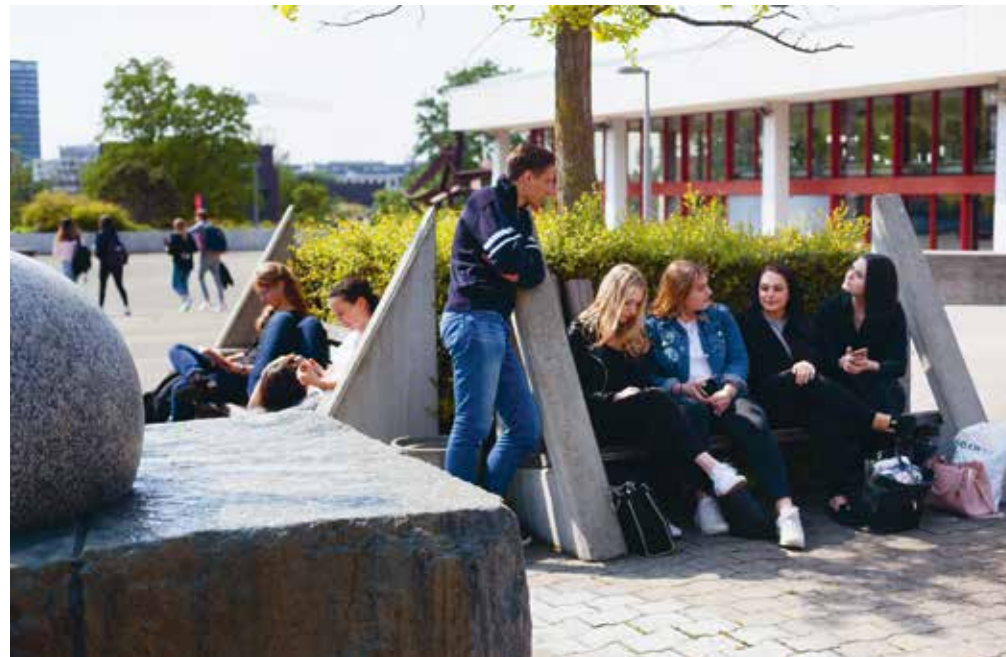
Beliebter Treffpunkt – Begegnungen und Austausch auf dem Schulhof.