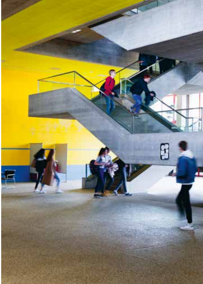
Kantonsschule Zug – Gymnasium und WMS unter einem Dach.