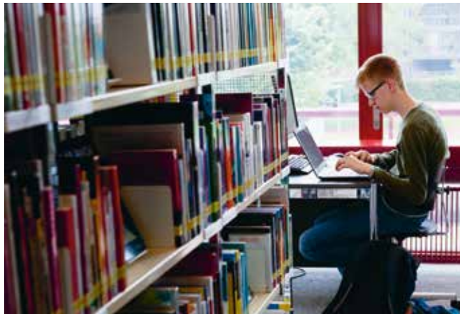
Selbstständiges Arbeiten am eigenen Laptop gehört zum Schulalltag.