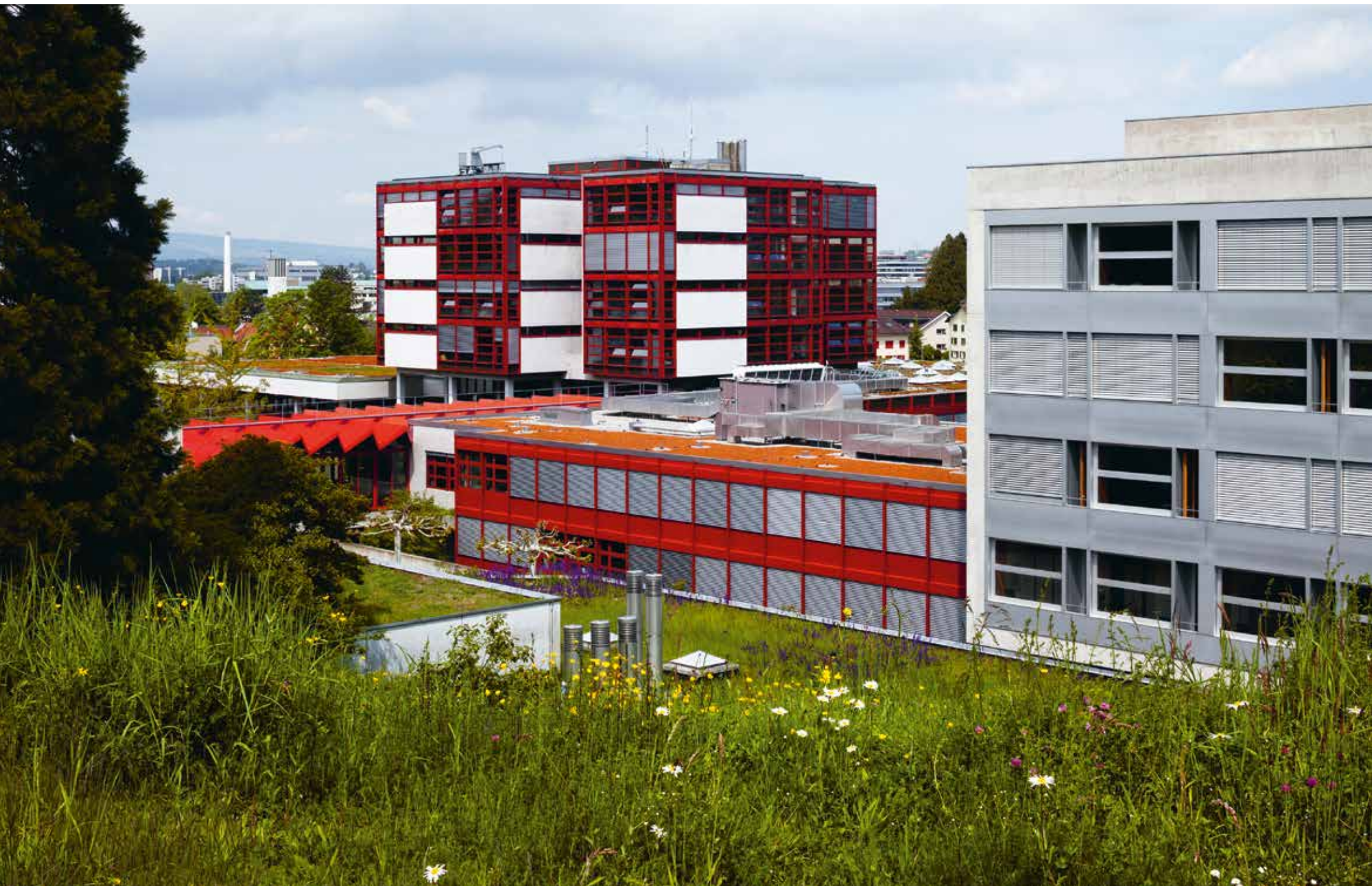
Der Campus der Kantonsschule Zug - ruhig gelegen, aber doch zentral, nur wenige Minuten vom Bahnhof Zug entfernt.