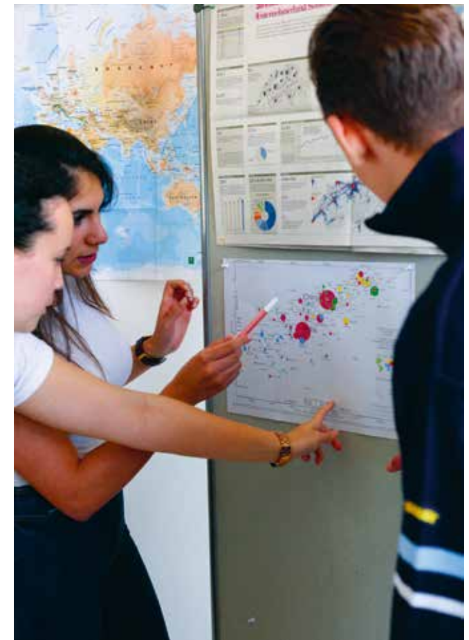
Argumentieren und Präsentieren – laufend werden diese Techniken eingeübt.