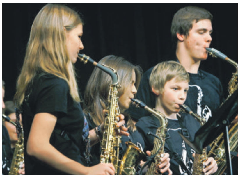
Ein betörendes Konzert: Jugendliche beim gemeinsamen Musizieren.