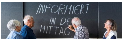
Rückblick - Ausblick