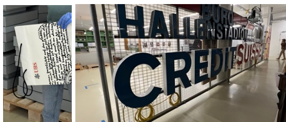
Banken: die eine wird grösser, die andere verschwindet, aber bleibt in Erinnerung