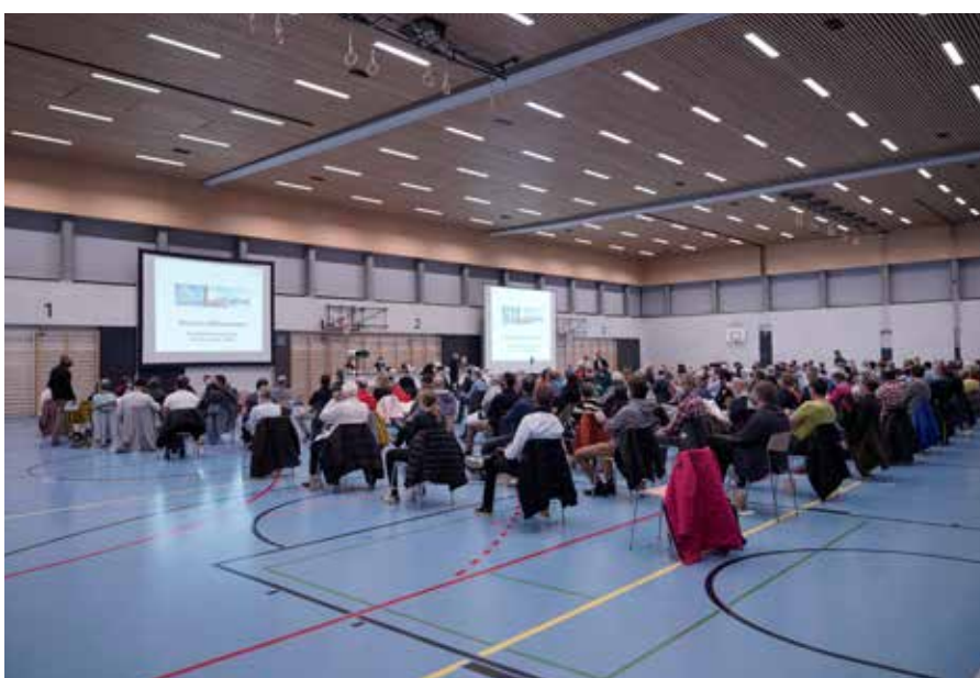
Gemeindeversammlung vom 25. November 2020 in der Dreifachturnhalle Ochsenmatt Menzingen

Vergünstigungsaktion vom 1. November bis 31. März: Gibt es während der erwähnten Zeitdauer noch freie SBB-Tageskarten, können diese am Vortag des Gültigkeitstages ab