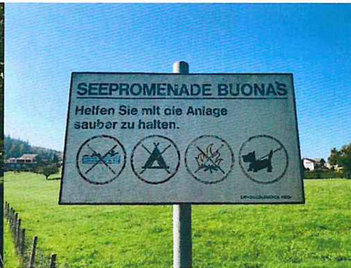
Schlecht lesbare Verbotstafel