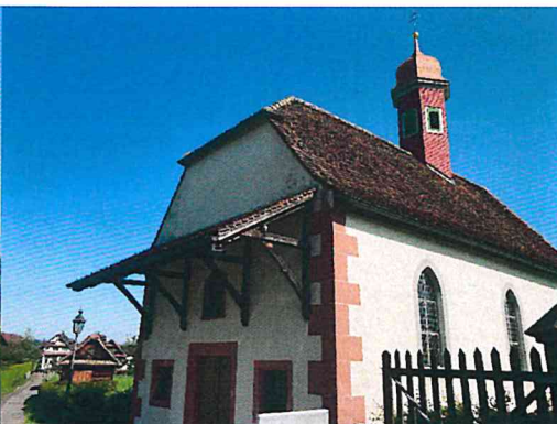
Nächstens öffentliche WC bei der Kapelle St. German Buonas