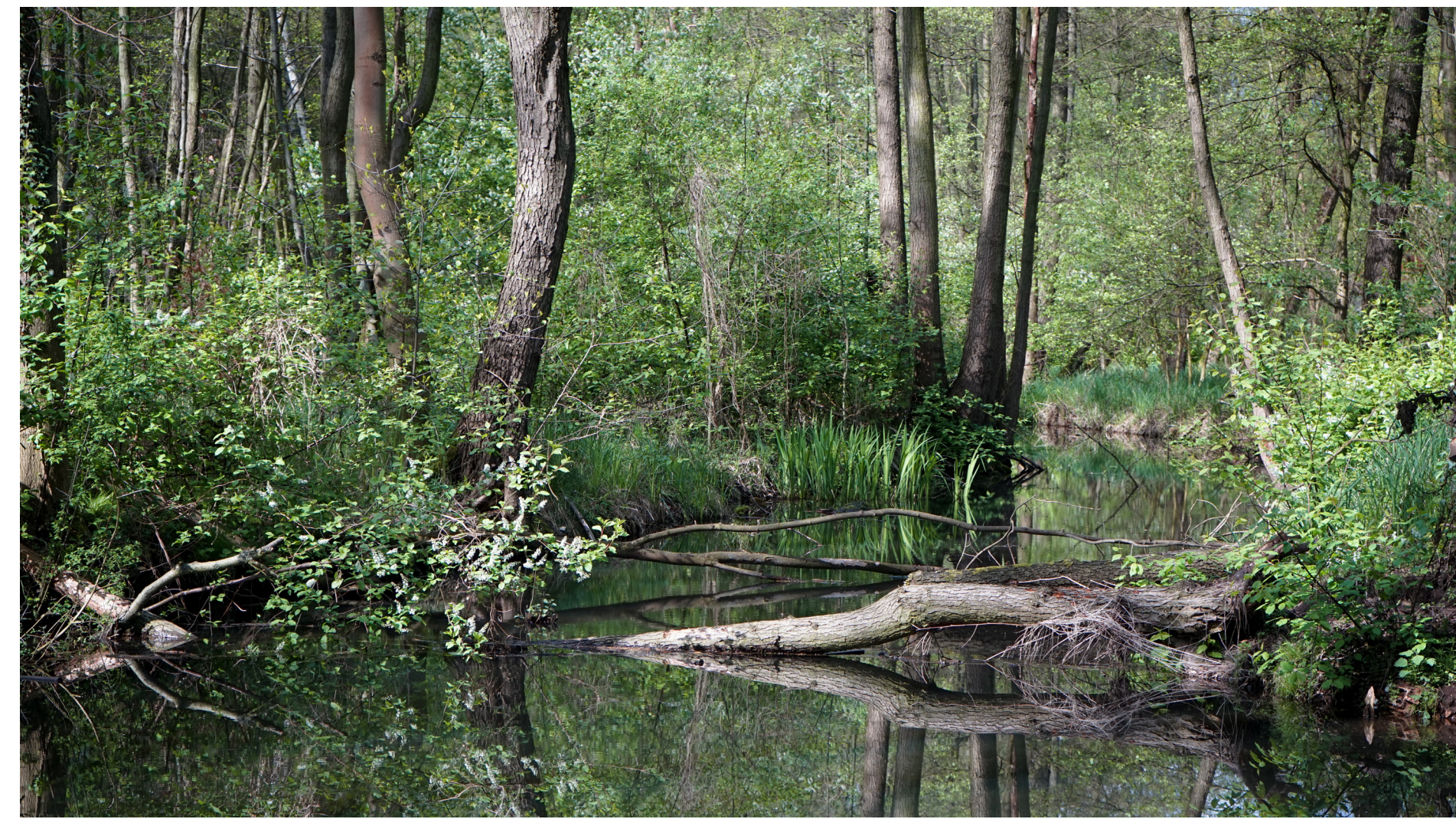
Den Weiher und seine Umgebung aufwerten

Gewässerlebensräume aufwerten - Naturerlebnis steigern