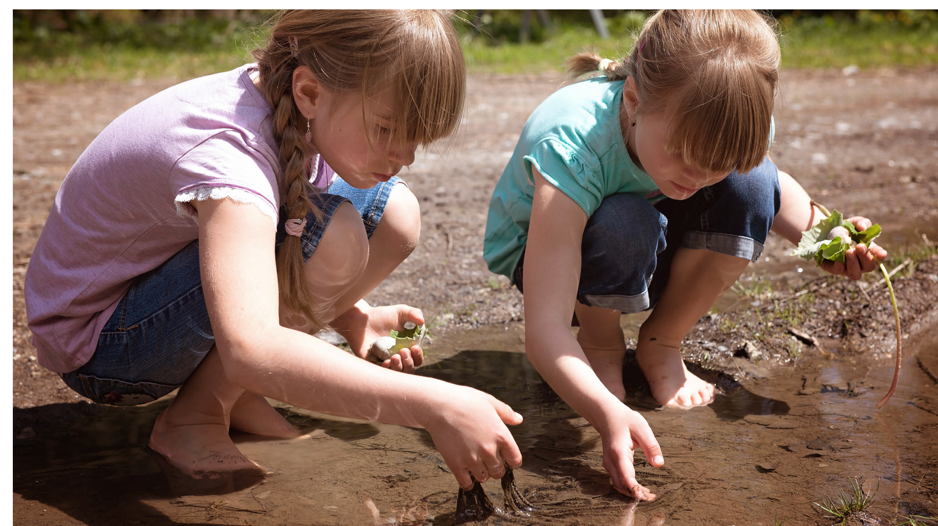
Natur auf eigene Faust entdecken