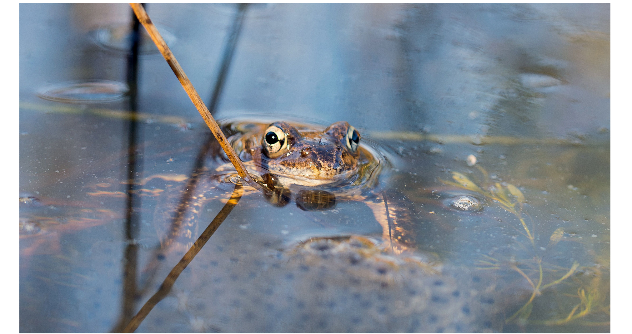
Laichgewässer für die grosse Zahl von Fröschen und Kröten optimieren