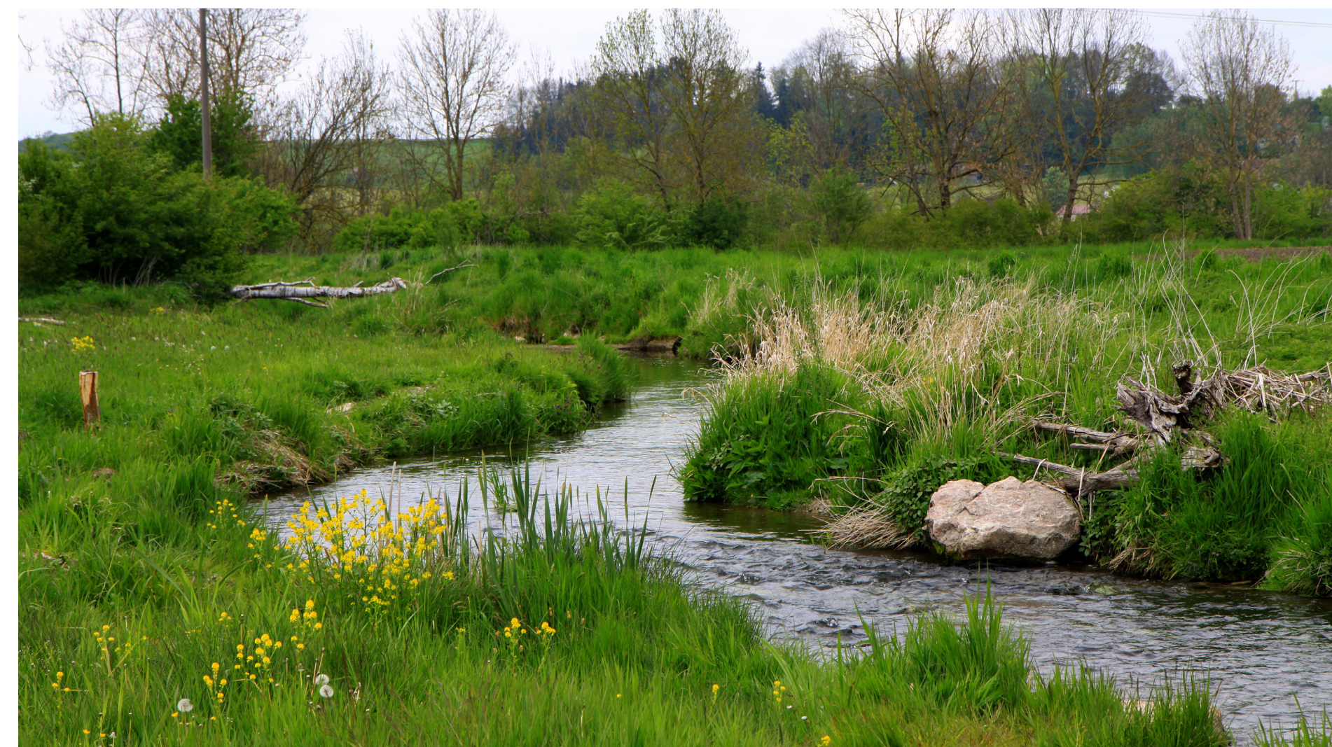
Auslauf aus dem Weiher als Wiesenbach gestalten