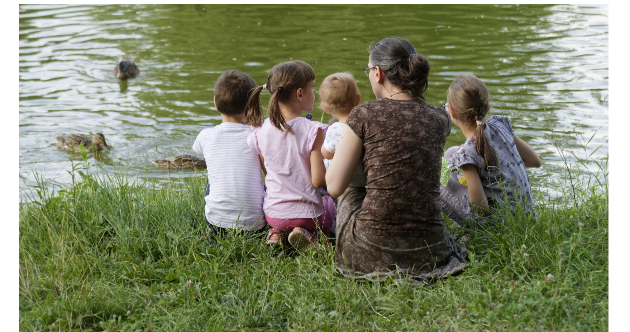
Gewässer aus der Nähe erleben können