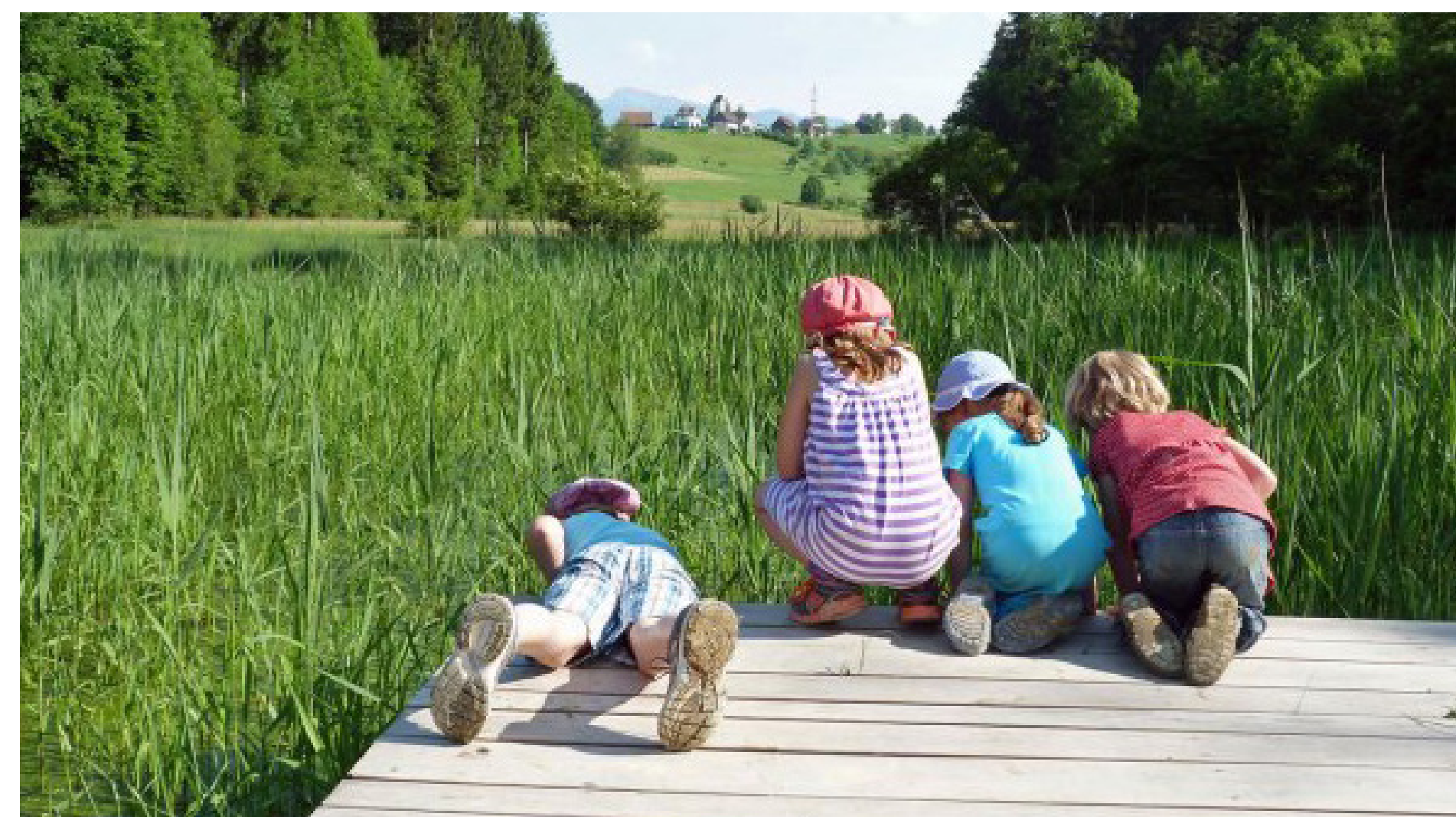
Dank einfachen Holzplattformen Naturgenuss direkt am Wasser ermöglichen