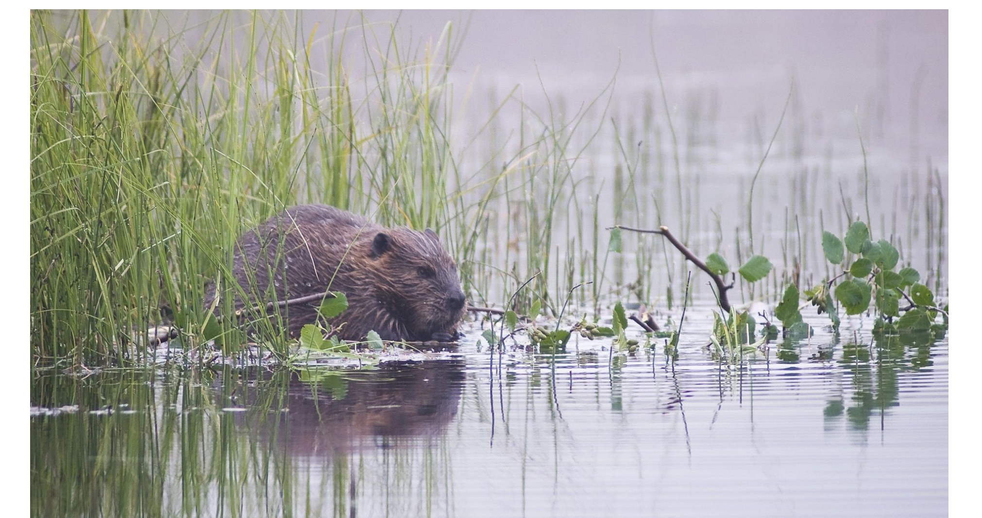
Lebensraum erhalten, z.B. für den Biber, der seit Kurzem am Binzmüliweiher lebt