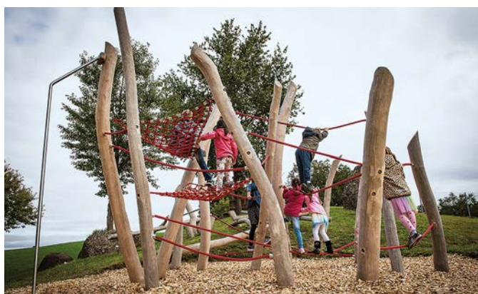
... und in Holzhäusern.