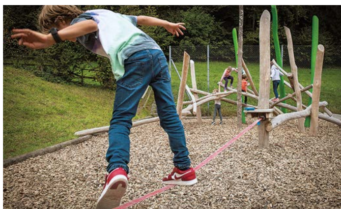
Die neuen Spielplätze in Risch...