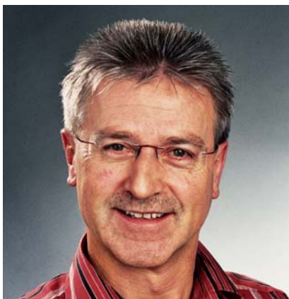
Gemeinderat Vorsteher Abteilung Bildung Im Amt seit 1. Januar 2007 Beruf: Elektroingenieur HTL Partei: FDP