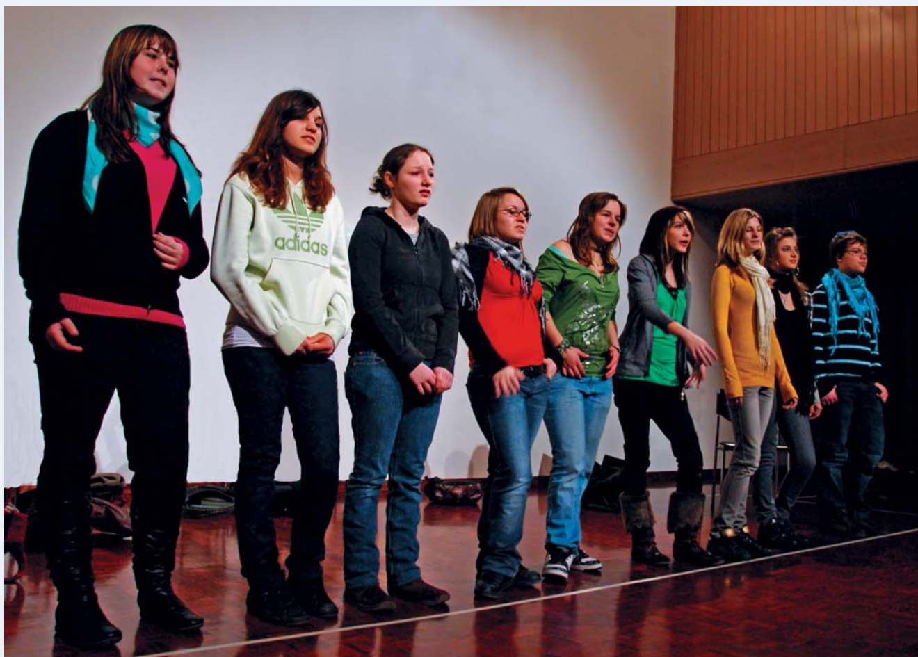
Casting-Stress: Wer wird von der Jury für die Doku-Soap ausgewählt?

Der Theater-Wahlfachkurs der 3. Oberstufe Rotkreuz führt unter der Leitung von Susanne Vonarburg sein selbstentwickeltes Stück auf.