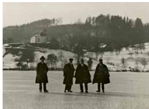
Seegrörne in Risch