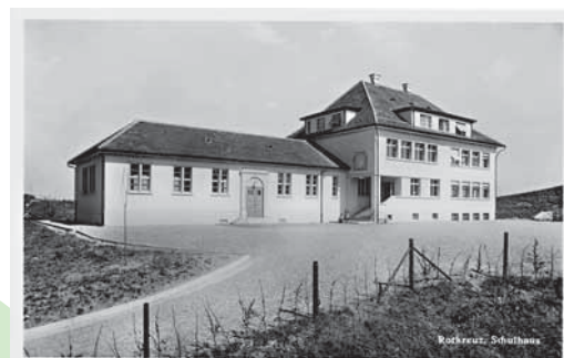
Neues Schulhaus in Rotkreuz