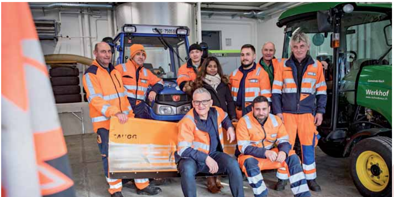
Das Werkhofteam wünscht Ihnen einen unfallfreien Winter!

Abteilung Planung/Bau/Sicherheit: 041 798 18 48 Werkdienst: 041 798 18 59 oder per E-Mail: werkhof@rischrotkreuz.ch