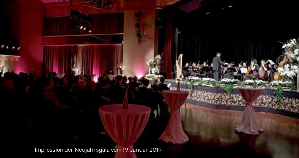
Impression der Neujahrsgala vom 19. Januar 2019.