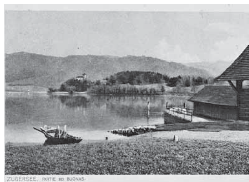
Schiffssteg in Buonas