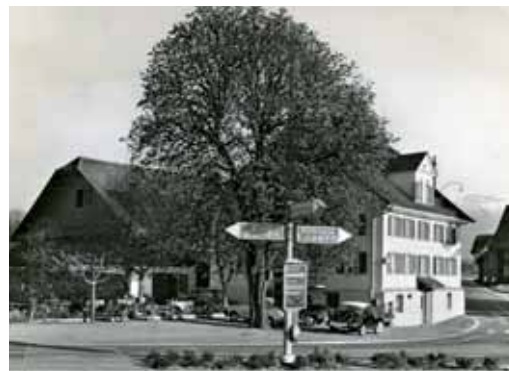
Gasthaus Engel in Holzhäusern