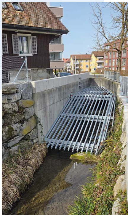
Sofortmassnahme Feinrechen vor dem Einlaufbauwerk Waldhof.

Das Vorprojekt befindet sich in der finalen Bearbeitung und soll Ende März 2026 den kantonalen Fachstellen sowie anschliessend dem Bundesamt für Umwelt (BAFU) zur Vorprüfung eingereicht werden. Die Rückmeldungen von Kanton und Bund aus diesen Vorprüfungen fliessen in die anschliessende Ausarbeitung des Baupro-