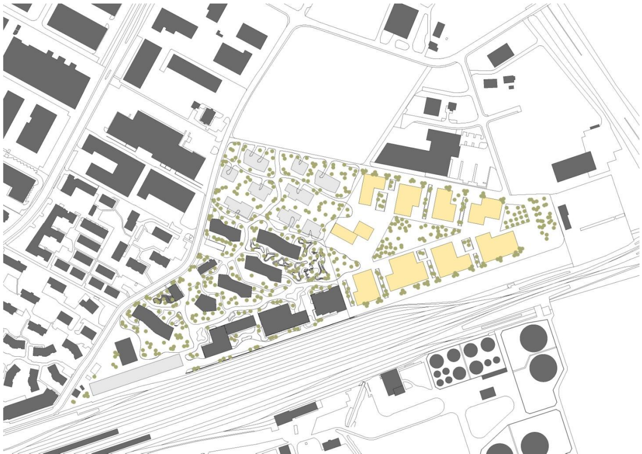
Abb. 1: Situation städtebauliches Konzept mit Hochhaus im Innenbereich

Städtebauliches Konzept mit Hochhaus im Innenbereich: