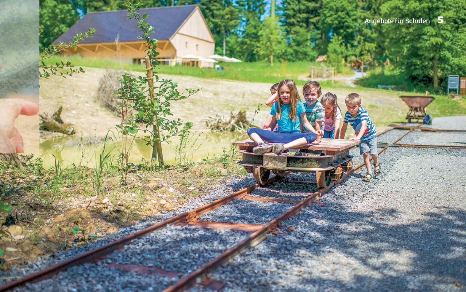
«Rollwägel-Fahren» im Ziegelei-Museum