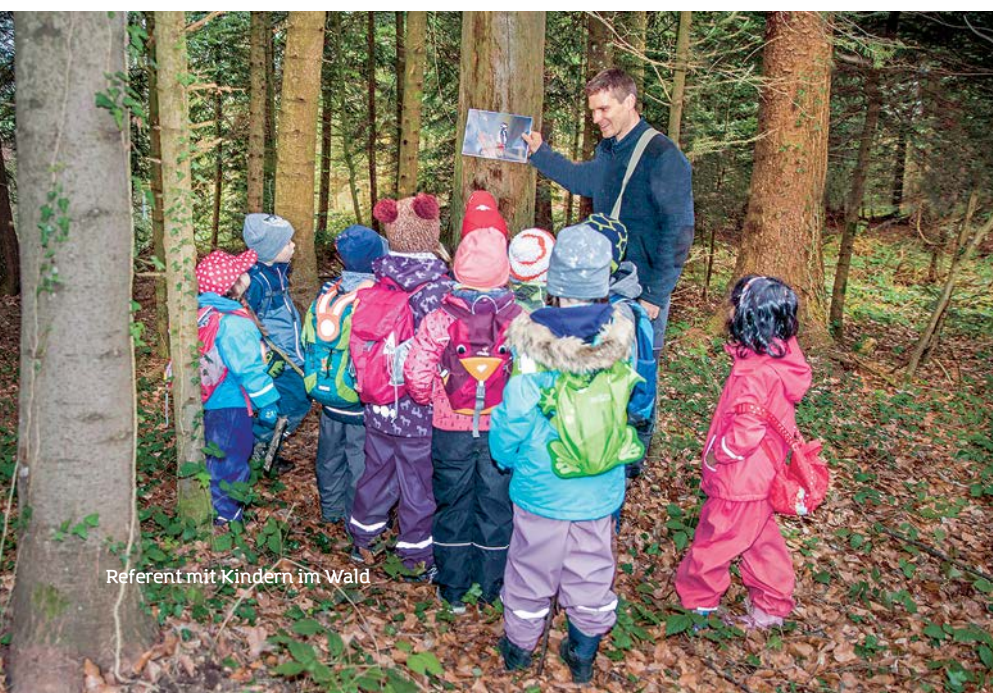
Referent mit Kindern im Wald

www.bannwaldzwaergli.ch info@bannwaldzwaergli.ch