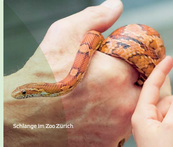
Schlange im Zoo Zürich

Interaktive Wandtafeln und Beamer machen Unterricht anschaulicher denn je. Wozu soll man noch das bequeme Schulzimmer verlassen und sich draussen etwas in natura anschauen?