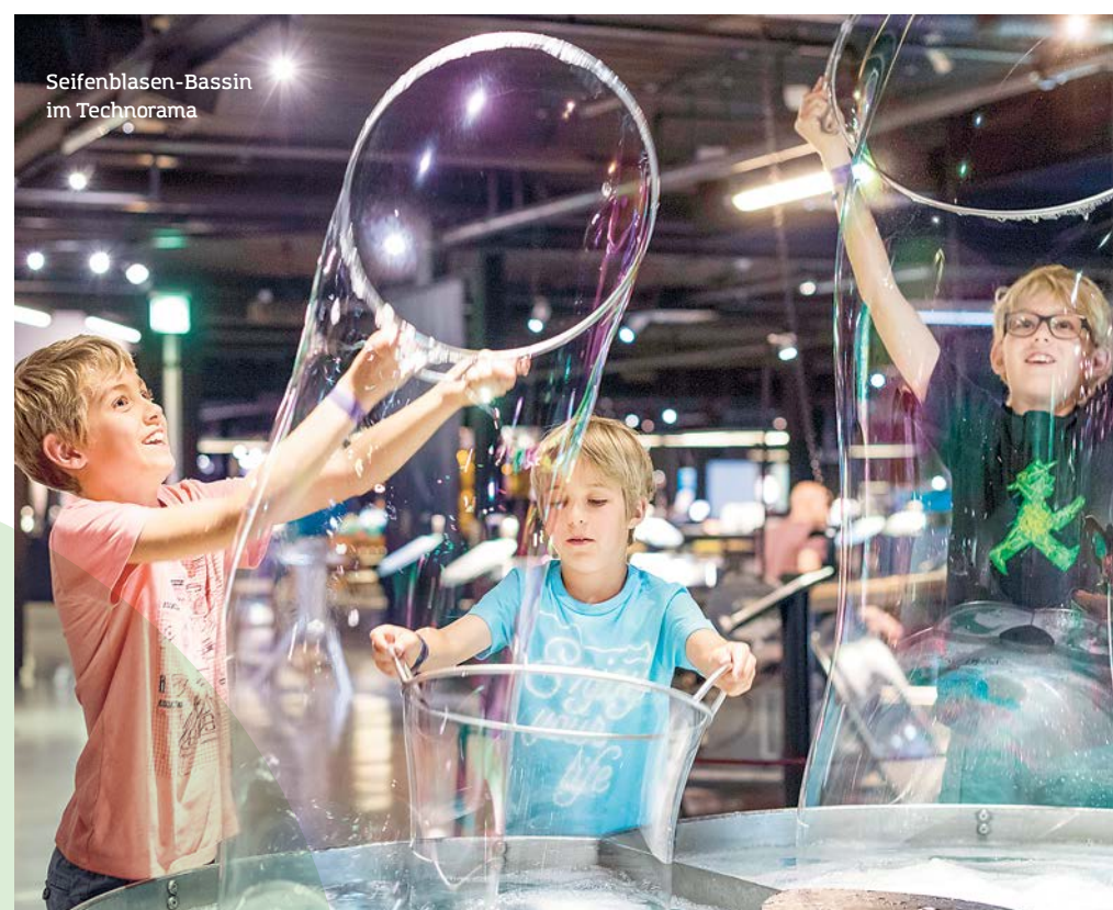
Seifenblasen-Bassin im Technorama