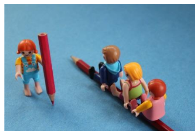
Eigenständigkeit, soziales Handeln