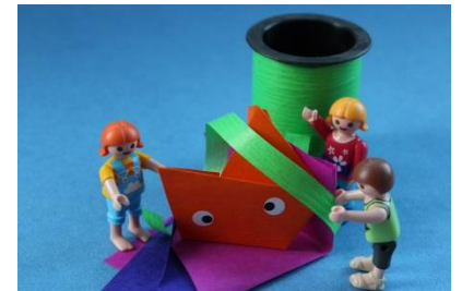
Fantasie und Kreativität