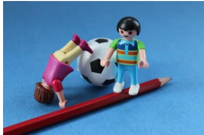
Körper, Gesundheit, Motorik