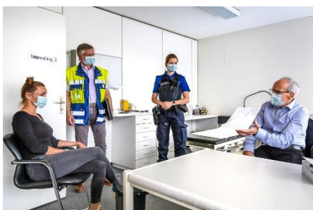
Der Kantonsarzt und die Zuger Polizei bei einem Kontrollbesuch in einer Arztpraxis

Im Gesundheitsbereich dürfen alle Arzt- und Zahnarztpraxen wieder Behandlungen durchführen. Auch die Spitäler und Kliniken dürfen wieder alle Eingriffe an Patientinnen und Patienten vornehmen.