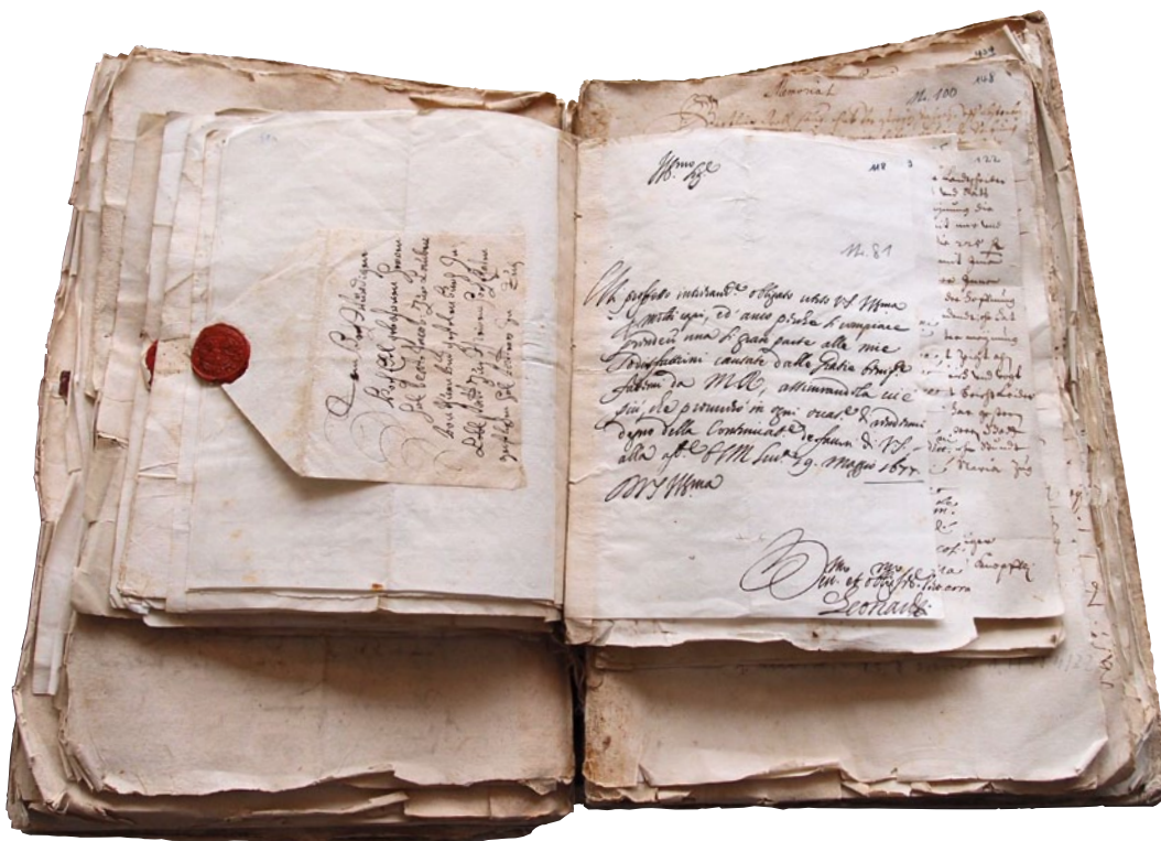
Abb. 1 Originalband der «Acta Helvetica» (Aargauer Kantonsbibliothek, MsZF 1:154).