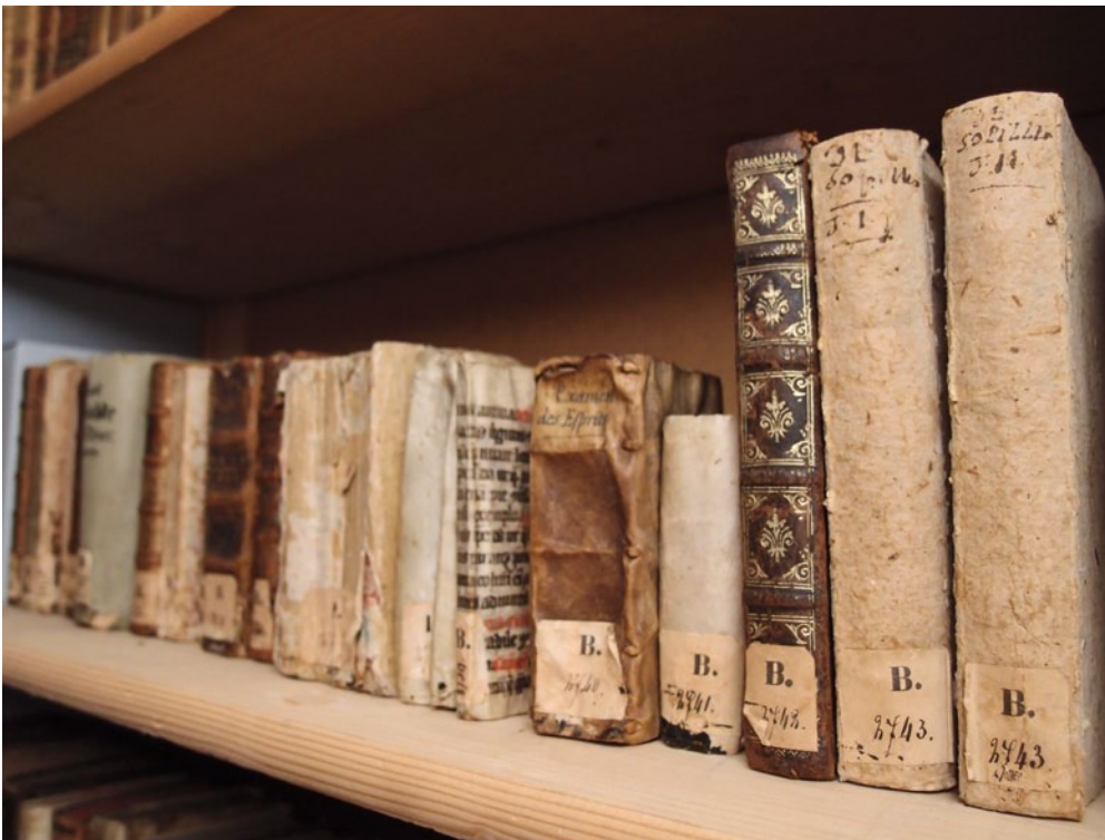
Abb. 7 Einige Bücher aus der Zurlauben-Bibliothek, wie sie sich heute im «Bücherturm» der Aargauer Kantonsbibliothek präsentieren.

der 1950er Jahre nahm der damalige Vizedirektor der Landesbibliothek, Wilhelm Joseph Meyer, die Erschliessung der «Acta Helvetica» an die Hand und liess über 22 000 Regesten, also kurze Zusammenfassungen des Inhalts mit Angaben von Datum, Entstehungsort sowie Orts- und Personennamen, zu den «Acta Helvetica» und den «Miscellanea Helveticae Historia» erstellen. Obwohl die Regesten ein beträchtliches Namenmaterial zur Personen- und Ortsgeschichte erschlossen, befriedigte diese Form der Bearbeitung die Fachwelt nur bedingt. 35