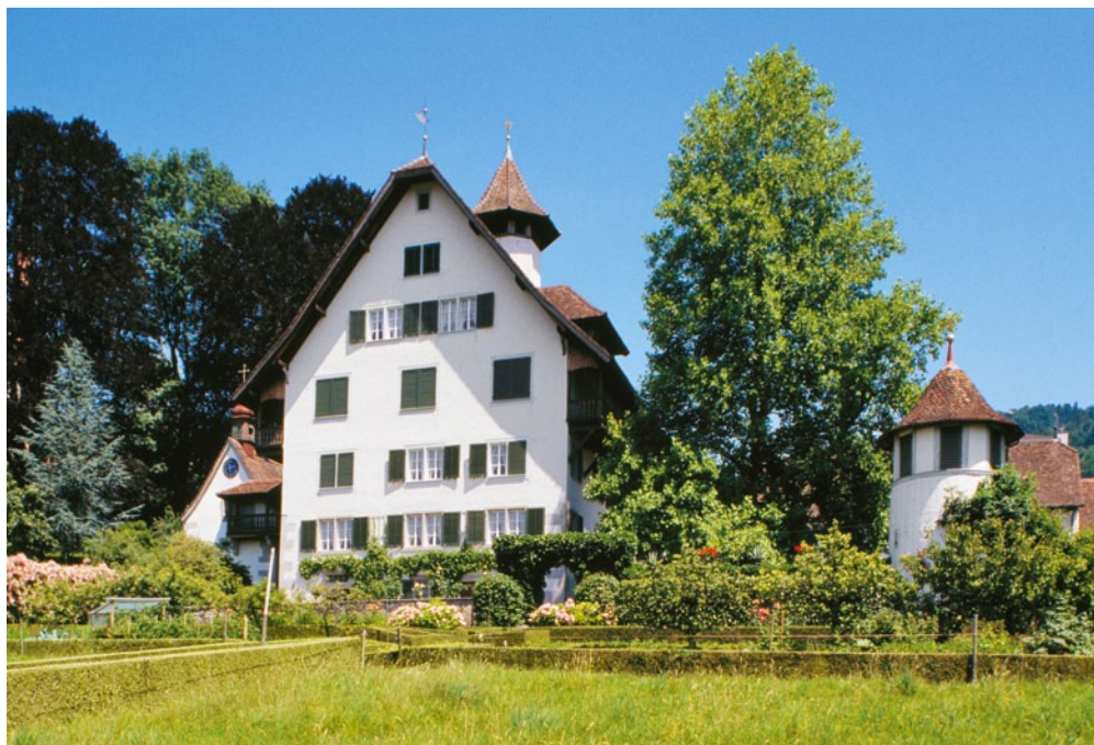
Abb. 2 Der «Zurlaubenhof» an der heutigen Hofstrasse in Zug war bis 1799 mit wenigen Unterbrüchen im Besitz der Familie Zurlauben.