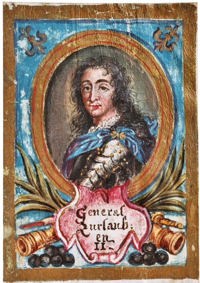
Abb. 3 Kolorierte Miniatur von Beat Fidel Zurlauben (1720–1799), Generalleutnant des Schweizer Garderegiments in französischen Diensten (Aargauer Kantonsbibliothek, MsZF 21: D).

grösstenteils Beat Fidel Zurlauben (1720–1799) zu verdanken, dem letzten männlichen Nachkommen der Familie (Abb. 3). 11 Seines Zeichens Offizier in französischen Diensten, sah sich Beat Fidel ebenso als Historiker wie als militärwissenschaftlicher Schriftsteller. 12 Hinzu kommt, dass er ein Büchernarr war, der die geerbte Familienbibliothek mit zahllosen Neuerwerbungen vermehrt hat – zu keiner Zeit ist die zurlaubensche Privatbibliothek dermassen angewachsen wie zu Lebzeiten von Beat Fidel. 13