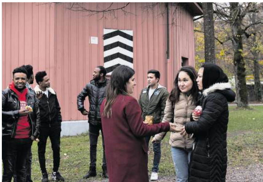
Die Integrationsklasse in einer Pause. Deutsch und Rechnen bereiten grosse Mühe.