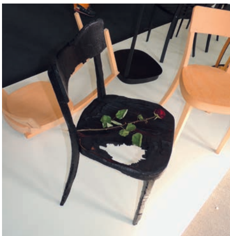
«Bad Seat»? Design à la Nick Cave