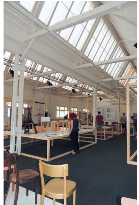
Die Zuger Shedhalle, leicht und luftig

«Die heutige Gestaltung des Empfangs mit «USM Haller»-Möbeln wird dem Haus nicht gerecht», sagt Luca Ste-