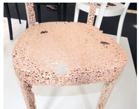
Fragil und zum Nachdenken anregend

Luca Steger kann sich nach der HFTG ein weiterführendes Studium vorstellen – eventuell wird er irgendwann die Ausbildung zum Innenarchitekten in Angriff nehmen. «Aber jetzt habe ich erst einmal eine Stelle in einem Büro gefunden und gehe arbeiten.» ■