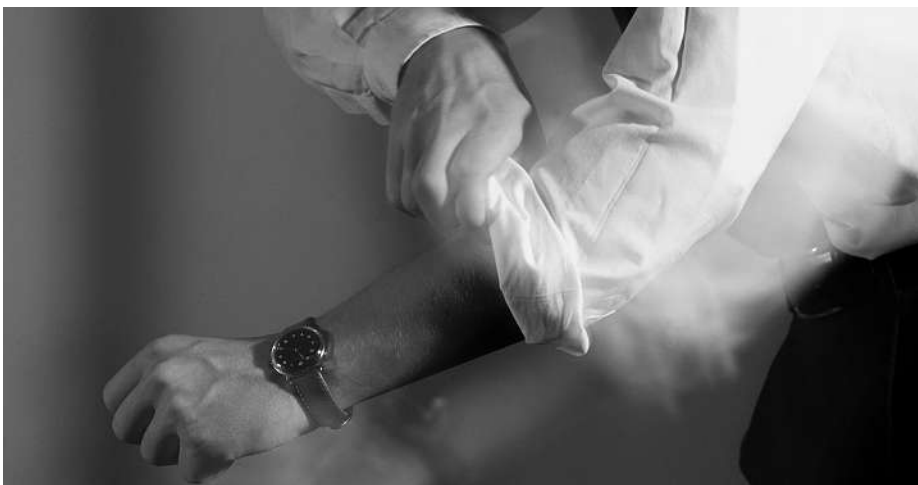
Mehr Handlungsfreiraum für den Gesellschafter.

Erfordernis kann durch ein Mitglied des Verwaltungsrates oder einen Direktor erfüllt werden. Die jährliche Meldepflicht an das Handelsregister über die Zusammensetzung der Gesellschafter entfällt. Das Stammkapital von mindestens 20'000 Fr. muss neu voll einbezahlt werden. Nach altem Recht genügte die Übertragung des Mindeststammkapitals von 20'000 Fr. mit 10'000 Fr.. Somit entfällt die subsidiäre Haftung aller Gesellschafter, die nach heutigem Recht bei nicht vollständig einbezahltem Kapital bestand.