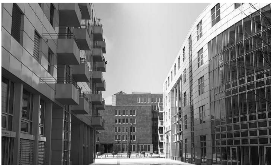
Ausschnitt aus dem Film «Small word – big Business»

Die Powerpoint-Präsentation beleuchtet mittels Grafiken, farbigen Bildern und wichtigen Standort-Zahlen auf 66 Seiten die Wirtschaftsregion