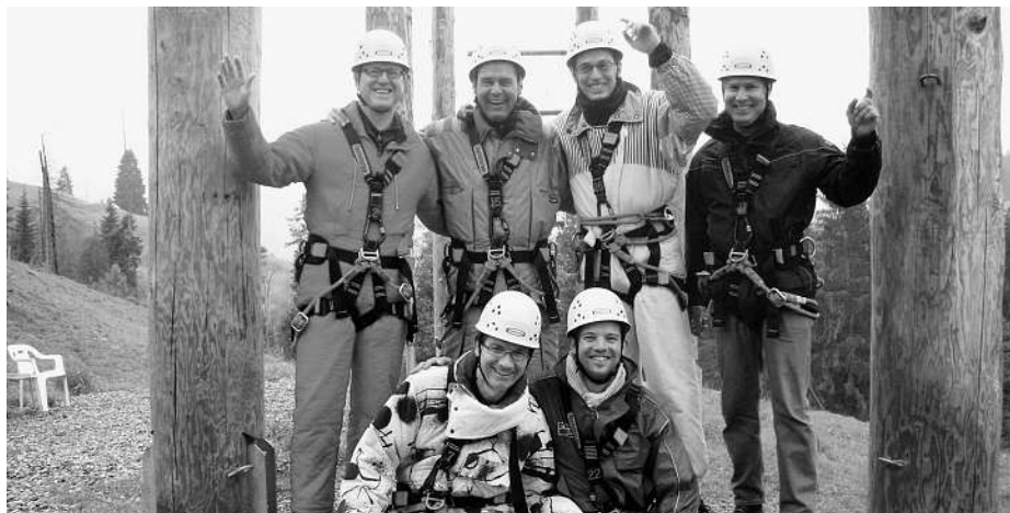
Der Vorstand auf Reise.

«Die Kammer Zug, gegründet 1976, ist mit 52 aktiven Mitgliedern eine der grössten Kammern in der Schweiz.»