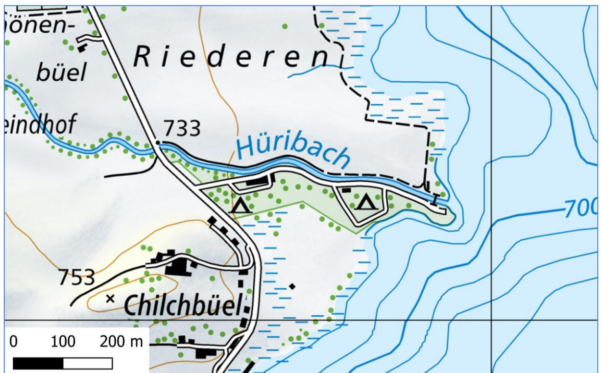
Abbildung 1: Lage des Campingplatzes

Der Campingplatz des Zeltklubs Zentralschweiz (ZKZS) befindet sich am Unterlauf bzw. im Mündungsbereich des Hüribachs in Unterägeri.