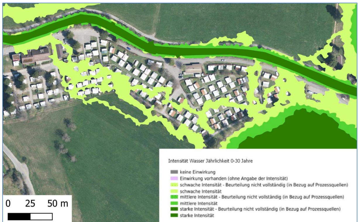
Abbildung 2: Intensitätskarte Wasser für ein 30-jähriges Ereignis [WMS-Link: https://geodienste.ch/db/gefahrenkarten_v1_3_0/deu | Luftbild: © Kanton Zug 2022]

Die nachfolgende Abbildung zeigt das Gebiet auf dem Areal des Campingplatzes, welches bereits bei einem 30-jährigen Ereignis (HQ30) von einer Überflutung betroffen wäre.