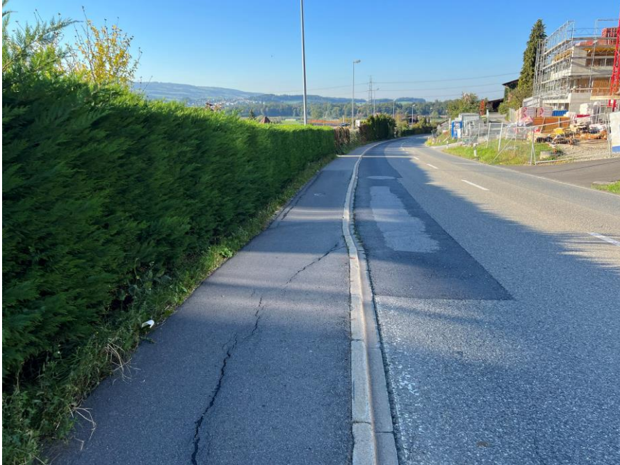
Die Fahrbahn des talseitigen Trottoirs der Drälikerstrasse in Hünenberg weist aufgrund von Setzungen grössere Verschiebungen in horizontaler und vertikaler Richtung auf.