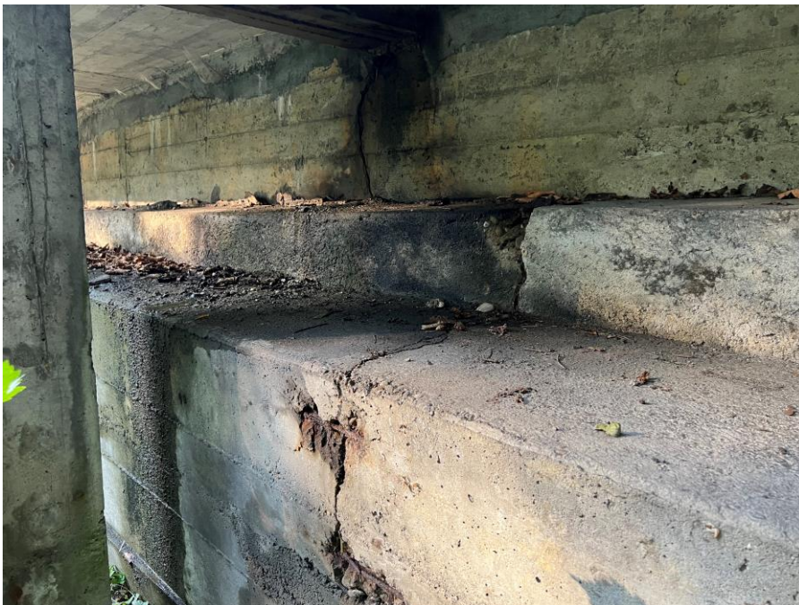
Die Stützkonstruktion beim Burgrank der Drälikerstrasse in Hünenberg ist aufgrund der zum Teil freiliegenden Armierung, Abplatzungen, Wasseraustritt und Hohlräumen in einem baulich schlechten Zustand.